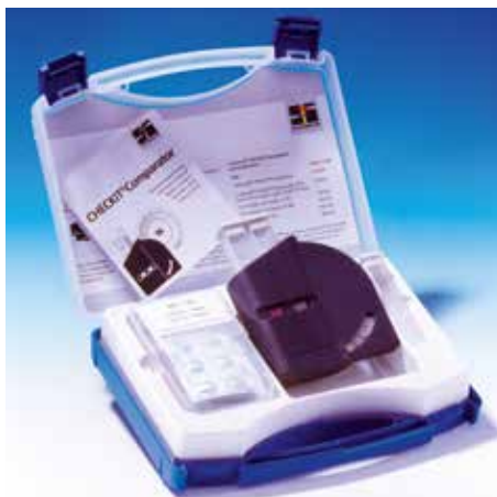
Komplet Test kita u kutiji