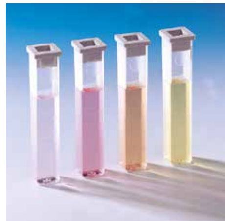
Plastične kivete, matirane sa dve strane, zapremine 10 ml, optički put 13.5 mm, sa poklopcem