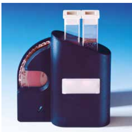
CHECKIT® komparator sa diskom, difuzerom i kivetima - pogled sa zadnje strane