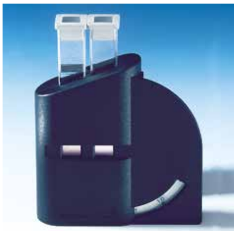
CHECKIT® komparator sa kivetama - pogled sa prednje strane