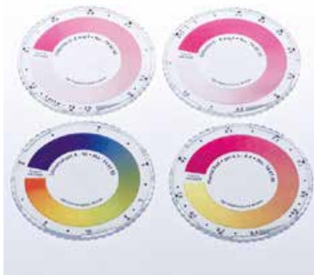
CHECKIT®Disk sa kontinualnom skalom boje