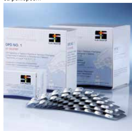
Tabletni reagensi u foliji, blister pakovanje