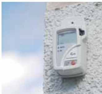
testo 175-T2 – Merenje spoljašnje temperature.

Logerom temperature testo 175-T2 može se pratiti spoljašnja temperatura. U poređenju sa merenom sobnom temperaturom, mogu se identifikovati gubici energije izazvani nepravilnom ventilacijom ili lošom izolacijom na objektu.