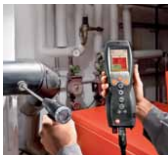
testo 330-2 LL – profesionalni gasni analizator.