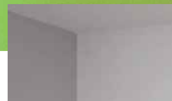
Identifikacija rizičnih mesta za razvijanje buđi