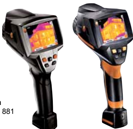
Termovizijska kamera testo 881