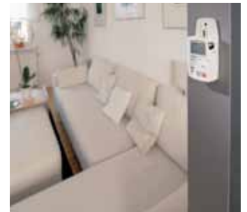
Testo 175-H2 – Merenje sobne temperature i ambijentalne vlažnosti.

Pored sobne temperature, aparatom testo 175-H2 se može tokom dužeg vremenskog perioda meriti i vlažnost vazduha. Grejanje i način na koji korisnici objekta vrše ventilaciju se mogu proceniti i sprovesti koraci u cilju uštede energije.