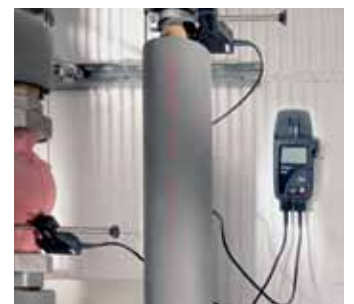
Testo 175-T3 – Merenje razlike temperatura na grejnim sistemima