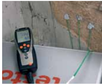
Testo 435 – Određivanje U-vrednosti na zidu pre renoviranja, bežičnom sondom i sondom za U vrednost.

Da bi se izvršila kalkulacija U-vrednosti, neophodne su tri vrednosti temperature: spoljašnja temperatura, temperatura površine unutrašnjeg zida i sobna temperatura. Bežične sonde omogućavaju brzo i lako merenje spoljašnje temperature bez otvaranja prozora. Pomoću nove, patentirane sonde za U-vrednost, sve