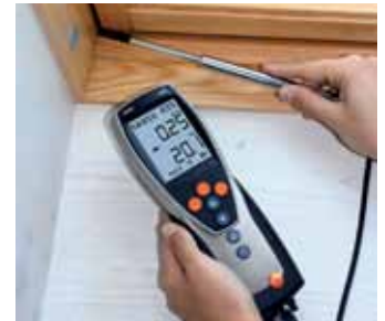
Testo 435 – merenje brzine strujanja na prozoru koji ne dihtuje.

U kombinaciji sa termalnom sondom, aparat testo 435 može detektovati i najmanje kretanje vazduha u sobama, n.pr. usled lošeg dihtovanja prozora ili utikača. Precizna termalna žica detektuje i najmanja strujanja.