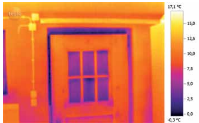
Blower Door: prikaz loše izolacije na vratima.

zgradi, tako da spoljašnji vazduh može da uđe u zgradu kroz loše zaptivene pukotine i spojeve. Termovizijska kamera značajno olakšava detekciju pukotina i propuštanja. Ovime se omogućava lokalizacija pukotina koje se mogu eliminisati pre svih skupih radova, čime se sprečavaju greške čije je uklanjanje skupo i izuzetno komplikovano.