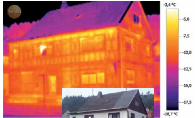
Loša izolacija na kući sa delimično drvenom građom.

pouzdanano analizirati i sa većih udaljenosti, n.pr. na krovu. Testo 881 takođe daje vredne informacije za restauraciju istorijskih građevina i spomenika. Nevidljivi konstrukcioni elementi sakriveni ispod maltera, kao što je drvena građa, postaju uočljivi čime se obezbeđuju bitne osnove planiranja za renoviranje i energetska efikasnost.