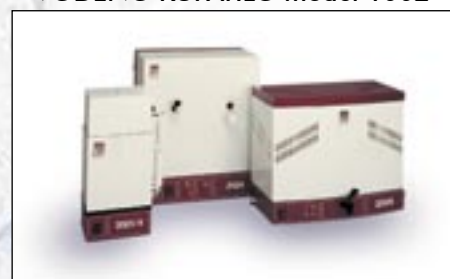
DESTILATORI I BIDEDESTILATORI