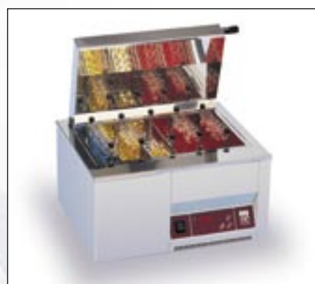
VODENO KUPATILO model 1002